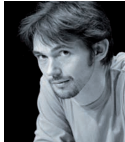
Illustration Jean de Brunhoff